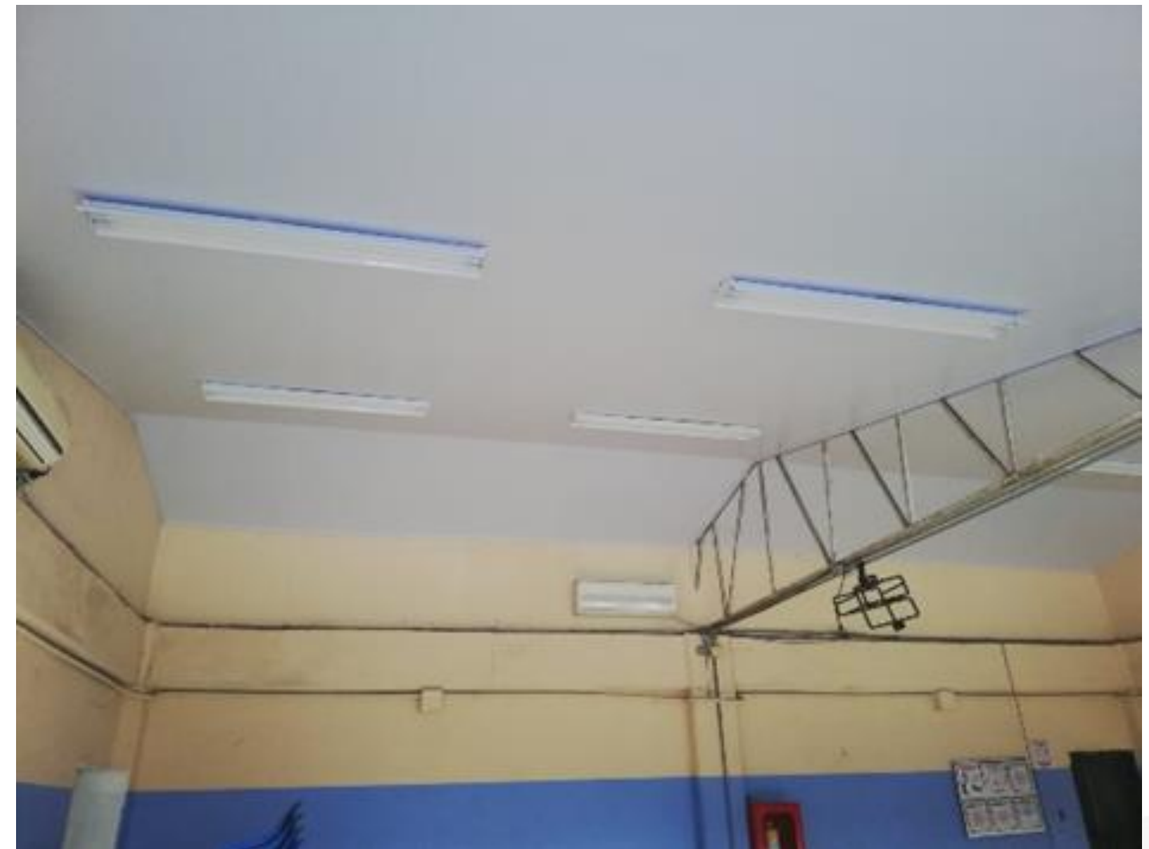
CAMBIO CIELO FALSOS BIBLIOTECA Y SALONES ELECTRICIDAD