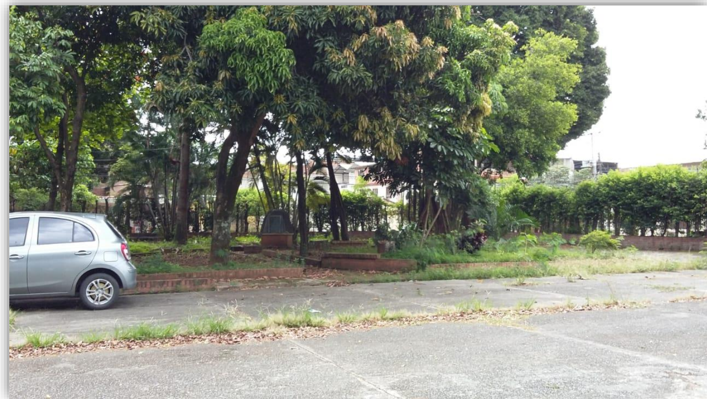
Mantenimiento de arboles tres sedes