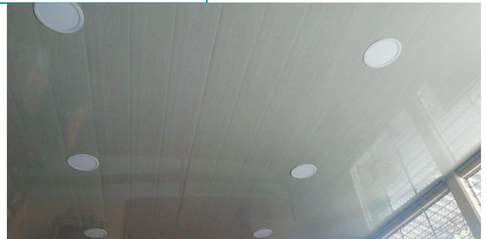
SALON DE TRANSICIÓN SEDE PANAMERICANA