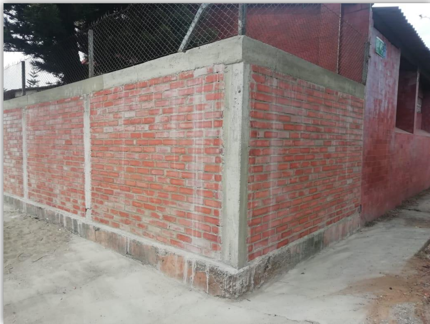
Muro de la sede Panamericana