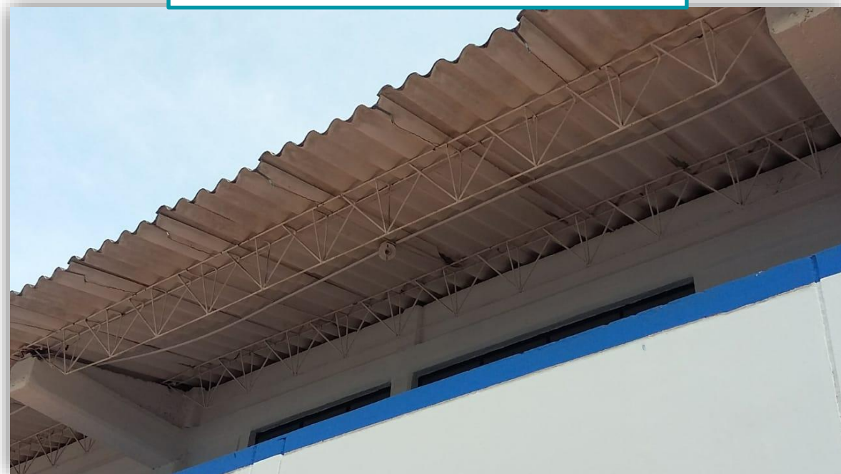
Ajustes de techos